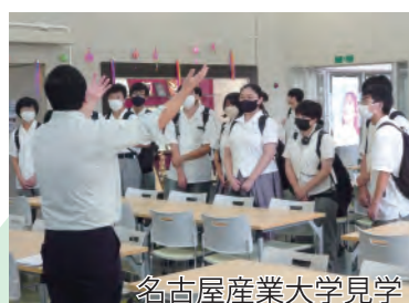
名古屋産業大学見学