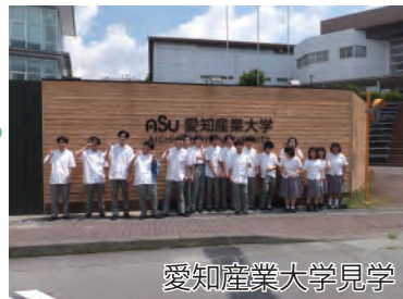
愛知産業大学見学