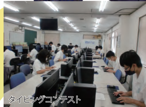
タイピングコンテスト