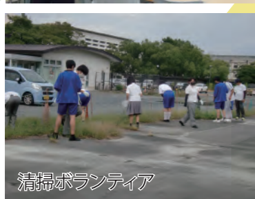
清掃ボランティア