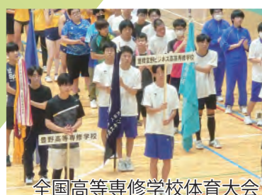
全国高等専修学校体育大会